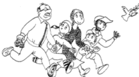
Proposta 1: 11 vots

Resultat de la votació realitzada durant l'acte de presentació de la diagnosi ( dissabte 5 de febrer )