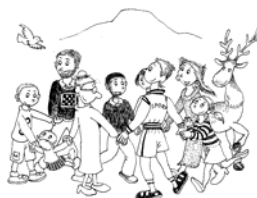
Proposta 2: 9 vots